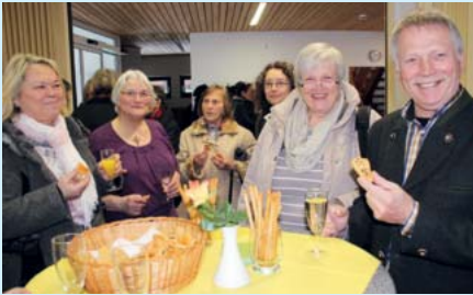
Bei geselligen Gesprächen klingt im Gemeindehaus der Festgottesdienst aus.