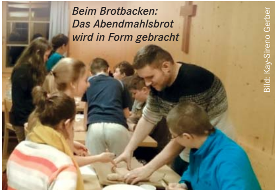
Beim Brotbacken: Das Abendmahlsbrot wird in Form gebracht