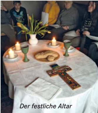
Der festliche Altar