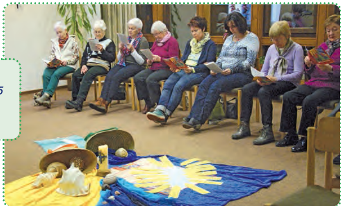
Frauen beim Weltgebetstag 2015 im Evangelischen Gemeindehaus